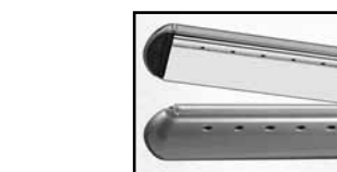
Vented plates for wet (damp) to dry hair